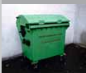
Nur für nutzlose Erfahrungen 2002, Müllcontainer, beschriftet