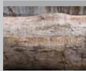
Tradition heute 2003, Eichenstamm, Buchstaben mit Acryl-Farbe hinterlegt