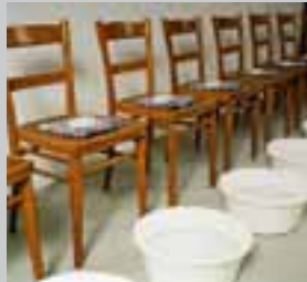
Füße waschen 1992, Installation, je 12 Stühle, Handtücher, Seifenstücke, Plastikwannen und Wasser