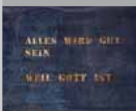
Alles wird gut sein, weil Gott ist 1999, Bleiband (18 x 1 m), Blattgold, Installation in St.Peter, Recklinghausen