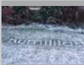
humilitas 2004, Installation, Humus, 390 cm, Galerie wit, Wageningen (NL)