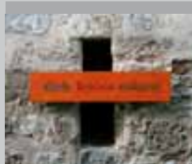
dich leiden mögen 2006, Eiche, Acrylfarbe, Ölkreide, Farbstift, ca. 70 x 21 cm