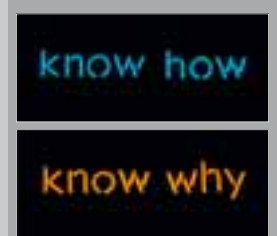
know how / know why 2007, Neoninstallation auf Plexiglas, ca. 65 cm breit, limitierte Auflage