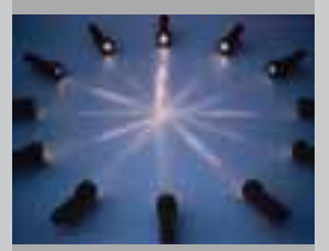
Licht nach innen 1993, Installation, 12 Taschenlampen