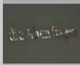
Die alten Fragen / die alten Fragen 2007, Glasinstallation, 2 Holzkästen auf dem Boden, Größe je 105 x 40 x 20 cm (LxBxH), limitierte Auflage