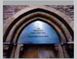
Wir wollen uns darin einig sein, dass wir uneins sind 1998, Installation, 2 teilig, Stahl, (Foto: Detail) Große Kirche in Burgsteinfurt