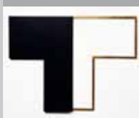
...auf Hoffnung hin 1991, ca. 60x45 cm, limitierte Auflage